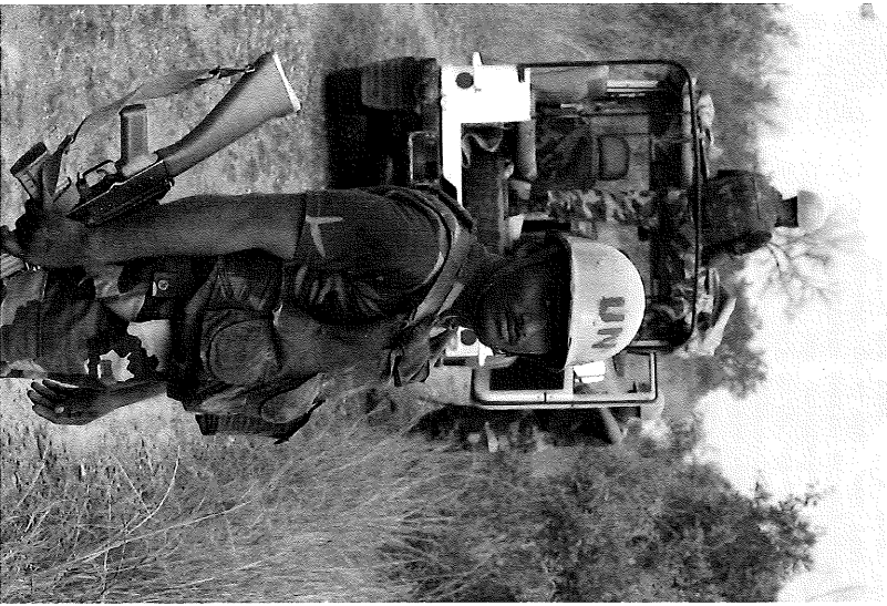
Der Friede wurde vom Kopf auf die Füsse gestellt: Peacebuilding-Mission im Kongo.