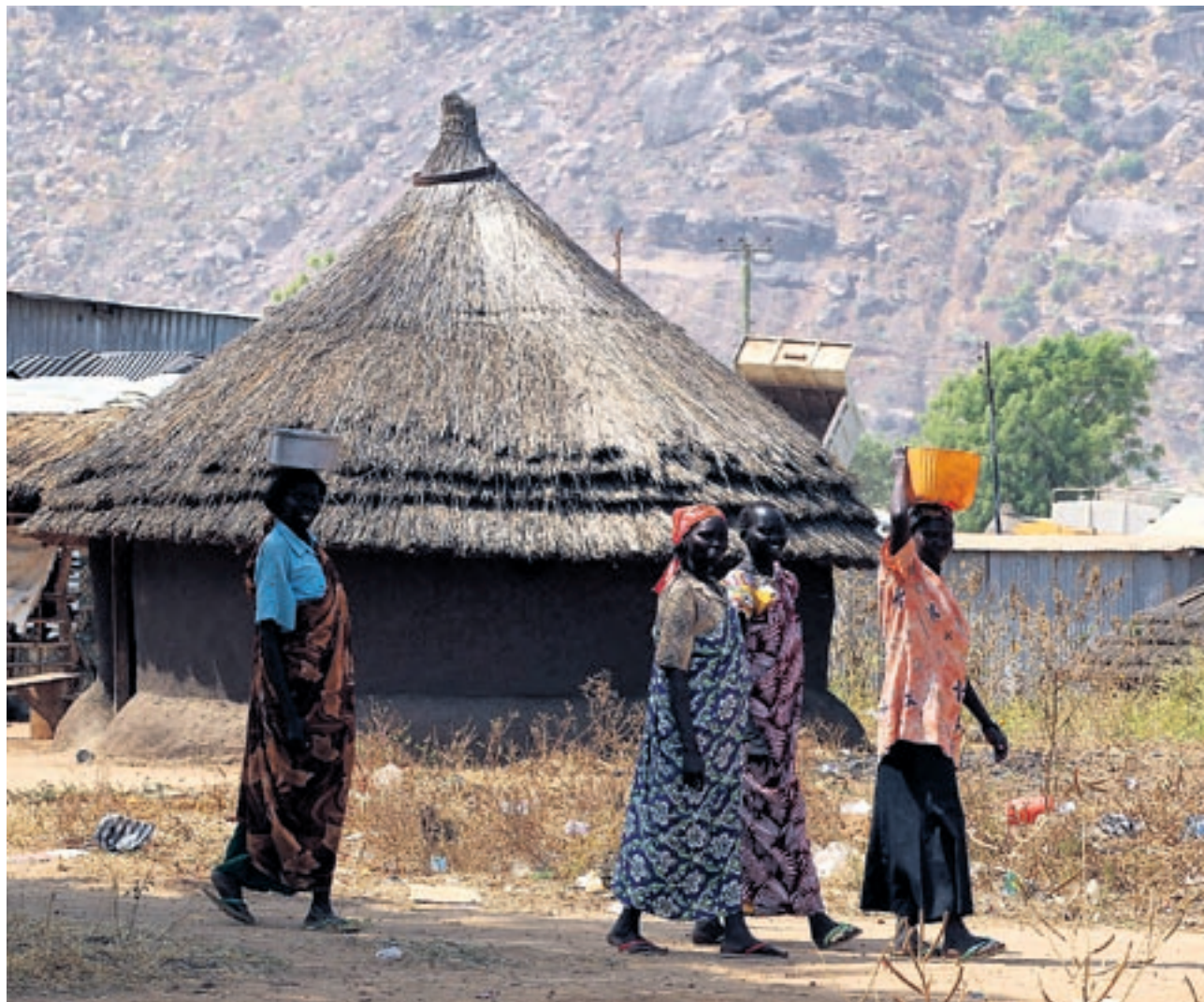
Südsudan beginnt auf bescheidenem Entwicklungsniveau: Aufnahme aus einer Hüttensiedlung in der Hauptstadt Juba.

der UNO, Hilfswerken und kirchlichen Institutionen erbracht. In der Region Jonglei im Südosten hat man beispielsweise in ländlichen Gebieten oft kaum Zugang zur Gesundheitsversorgung. Zudem fehlt auf dem Land ein Handynetzwerk, und es gibt kaum befestigte Strassen. Behindert wird der Aufbau auch dadurch, dass im Südsudan Fach-